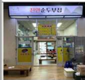
진안순두부집 (전북 진안군 진안읍 시장1길 16, 150호) 063)433-0622 추어탕 7,000원 / 순두부 7,000원 청국장 7,000원 / 육개장 7,000원