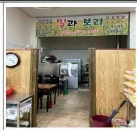
밀과보리 (전북 진안군 진안읍 시장1길 16, 134호) 010-3076-3526433 보리비빔밥 6,000원 / 된장찌개 6,000원 청국장 7,000원 / 제육볶음 8,000원