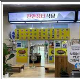
진안장터식당 (전북 진안군 진안읍 시장1길 16, 152호) 063)433-0481 훈대지불백 8,000원 / 다슬기탕 8,000원 추어탕 7,000원 / 뚝배기소불고기 8,000원