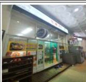
뚝배기 (전북 진안군 진안읍 시장1길 16, 148호) 063)433-5384 선지국밥 7,000원 / 콩나물국밥 7,000원 시래기국 7,000원 / 황태국 7,000원