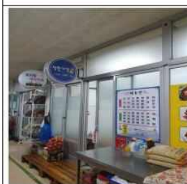
대만족 (전북 진안군 진안읍 시장1길 16, 143호) 063)432-8271 보리밥 6,000원 / 김치찌개 7,000원 칼국수 6,000원 / 갈비탕 7,000원